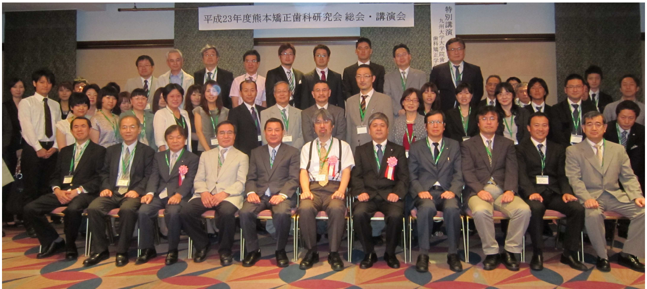
熊本矯正歯科研究会講演会 (H23. 7. 9 アークホテル熊本)

事務局:おにき矯正歯科クリニック内 〒861-4172 熊本市御幸笛田 1-9-38 TEL 096-334-8211 FAX 096-334-8210 E-Mail yasu1015@hyper.ocn.ne.jp