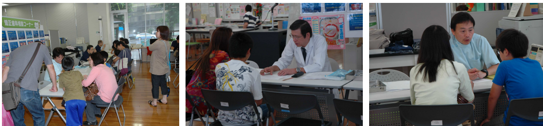
(2011 歯の祭典の矯正相談)